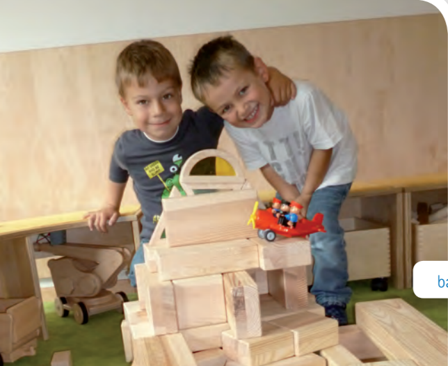
bauen und konstruieren

Auszug aus der Konzeption der Kath. Kindertageseinrichtungen. Die Konzeption liegt in der Einrichtung aus.